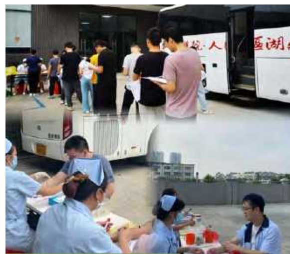
全员职业健康体检

爱晟定期对工作场所职业危害因素进行检测，第三方检测结果符合《中华人民共和国职业病防治法》相关要求。