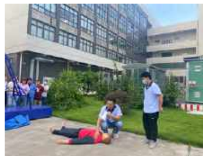
安全生产应急演练

公司拥有5台特种设备，每年1月委托第三方有资质公司对特种设备进行检验并出具具有法律效应的报告。